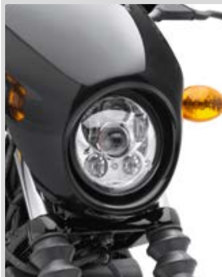
B. DAYMAKER LED-SCHEINWERFER – CHROM