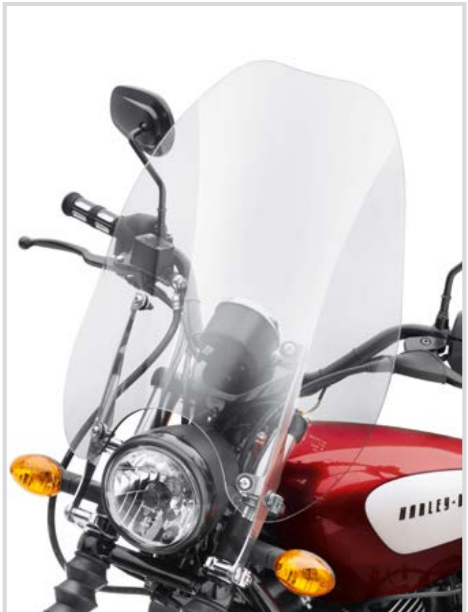
A. ABNEHMBARE SUPER SPORT WINDSCHUTZSCHEIBE