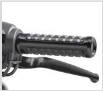
C. DOMINION LENKERGRIFFE – SCHWARZGLÄNZEND