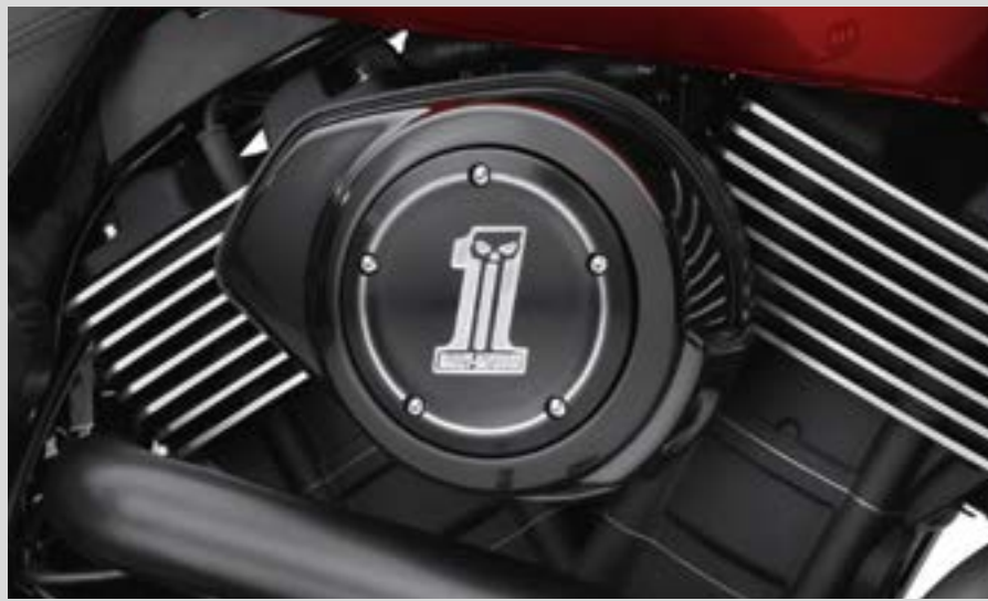
C. DARK CUSTOM LOGO KOLLEKTION – LUFTFILTER-ZIERBLENDE