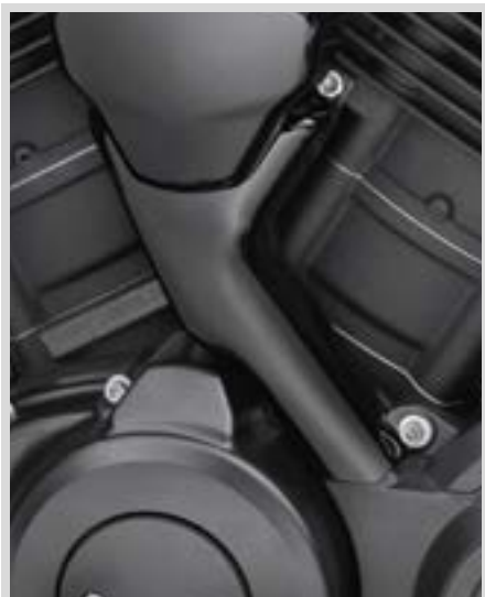
E. KÜHLMITTELSCHLAUCHABDECKUNG – SCHWARZGLÄNZEND