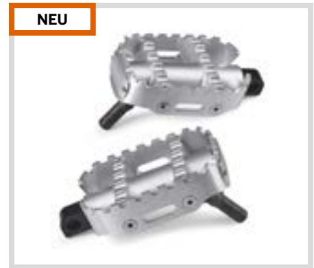
A. 80GRIT FUSSRASTEN – UNBEHANDELT