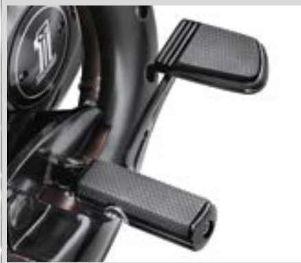
E. DEFIANCE KOLLEKTION HAND- UND FUSSHEBEL – SCHWARZELOXIERT