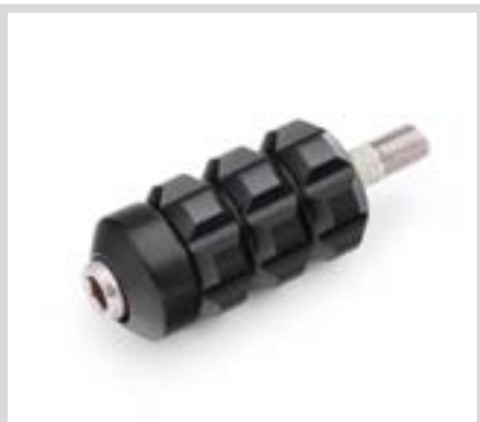
E. DOMINION SCHALTFUSSRASTE – SCHWARZGLÄNZEND