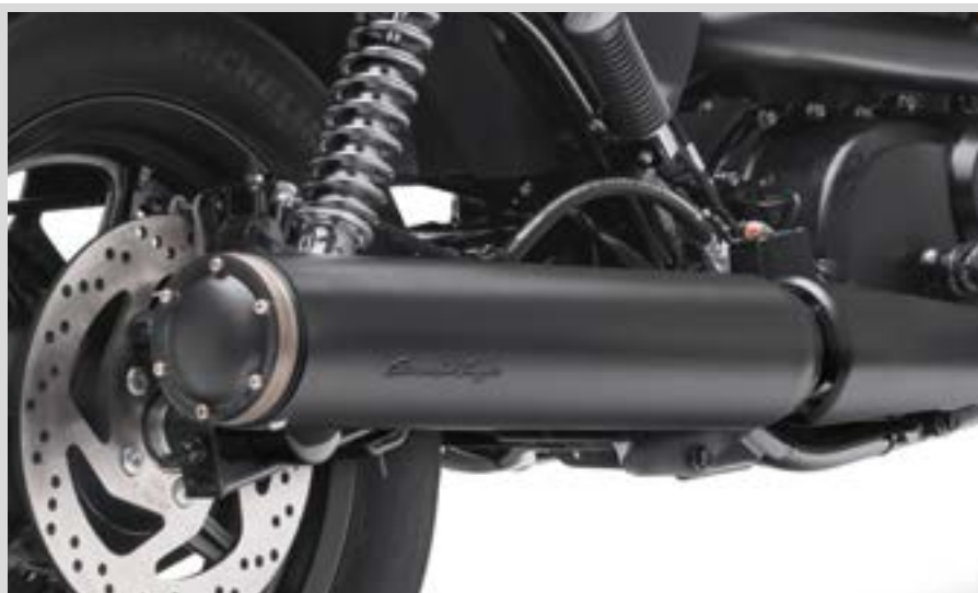
F. SCREAMIN' EAGLE NIGHTSTICK 2-IN-1 SLIP-ON-SCHALLDÄMPFER – JET BLACK

Für XG Modelle ab '15 (außer XG750A). Modelle ab '17 erfordern eine Neukalibrierung mit Screamin' Eagle Pro Street Tuner* (separat erhältlich). Arbeitskosten sind nicht im Preis enthalten. Weitere Einzelheiten erfahren Sie von Ihrem Händler.