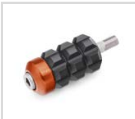
F. DOMINION SCHALTFUSSRASTEN-ZIERTEILE (ORANGE GEBÜRSTET ABGEBILDET)

DOMINION™ KOLLEKTION HAND- UND FUSSHEBEL Bringen Sie Ihre mutige, unangepasste Haltung zum Ausdruck. Die Bedienelemente der Dominion Kollektion für Fahrer und Beifahrer ermöglichen Ihnen ein gänzlich eigenes Styling.