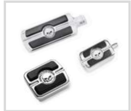
B. WILLIE G SKULL KOLLEKTION FUSSHEBEL – CHROM