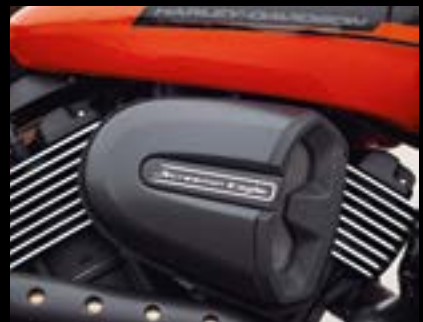
Screamin' Eagle Performance-Luftfiltersatz .....S. 32