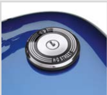
G. TANKDECKEL-MEDAILLON – H-D STREET SCHRIFTZUG

Für XG Modelle ab '15. 61300586 H-D Street-Schriftzug. 61300585 H-D Motor Co.-Schriftzug.