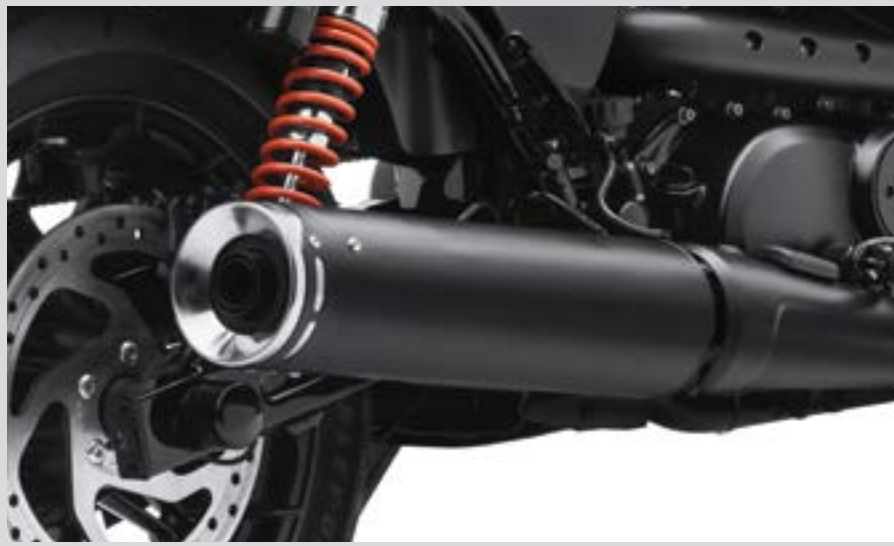
E. SCREAMIN' EAGLE STREET PERFORMANCE SLIP-ON SCHALLDÄMPFER