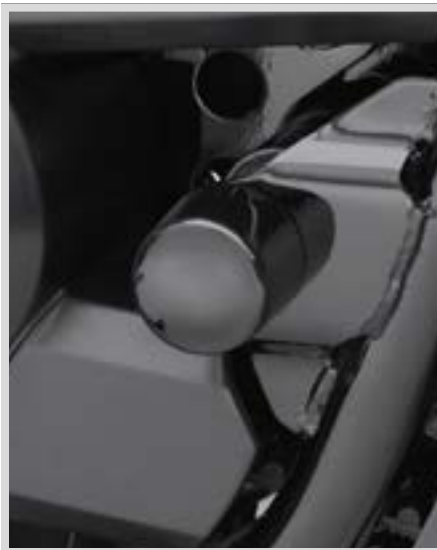
D. ABDECKUNGEN FÜR SCHWINGENACHSBOLZEN – SCHWARZGLÄNZEND