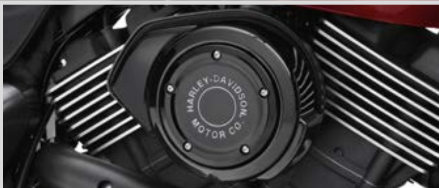
H. HARLEY-DAVIDSON MOTOR CO. KOLLEKTION – SCHWARZ MIT CHROM-SCHRIFTZUG – LUFTFILTER-ZIERBLENDE

25700308 Medaillon linke Seite. Für XG Modelle ab '15.