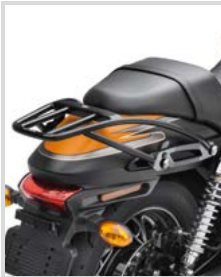
E. H-D DETACHABLES GEPÄCKTRÄGER FÜR DOPPELSITZBANK