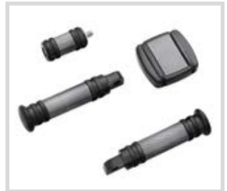
D. DIAMOND BLACK KOLLEKTION FUSSHEBEL

*Die Harley-Davidson Motor Company kann nicht alle möglichen Kombinationen aus Spiegeln und Lenkern testen und hierzu Montageempfehlungen aussprechen. Daher muss nach der Montage von neuen Spiegeln oder Lenkern geprüft werden, ob die Spiegel dem Fahrer freie Sicht nach hinten ermöglichen.