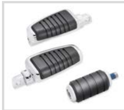
C. KAHUNA KOLLEKTION FUSSHEBEL – CHROM