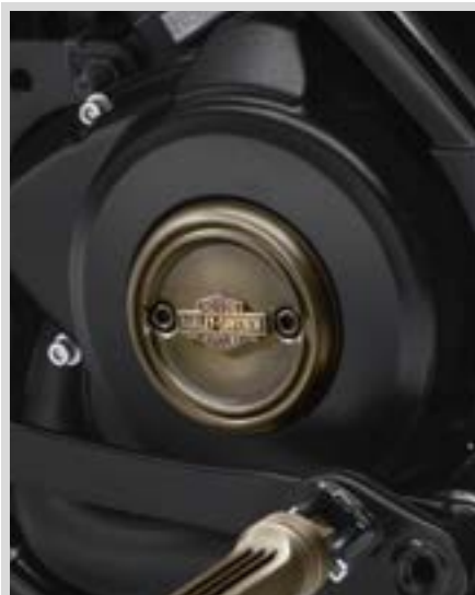
D. MESSING-KOLLEKTION – MEDAILLON LINKS

Nicht alle Produkte sind in allen Ländern erhältlich – wenden Sie sich für Einzelheiten bitte an Ihren Händler.