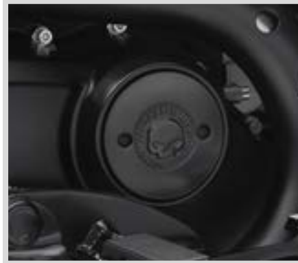
A. WILLIE G SKULL KOLLEKTION – MEDAILLON RECHTS – SCHWARZ