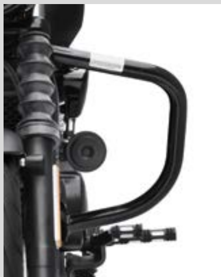
D. MOTORSCHUTZBÜGEL – SCHWARZGLÄNZEND