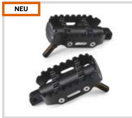
A. 80GRIT FUSSRASTEN – SCHWARZ