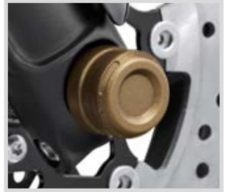
A. DOMINION MUTTERNKAPPEN FÜR VORDERACHSE – BRONZE