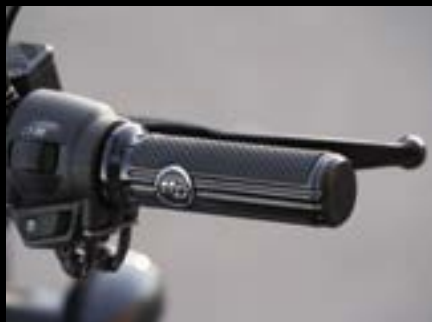
Defiance Lenkergriffe .....S. 25