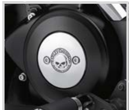
B. WILLIE G SKULL KOLLEKTION – MEDAILLON LINKS – CHROM