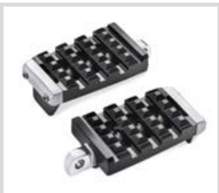
F. DOMINION FUSSRASTEN-ZIERTEILE (ALUMINIUM GEBÜRSTET ABGEBILDET)