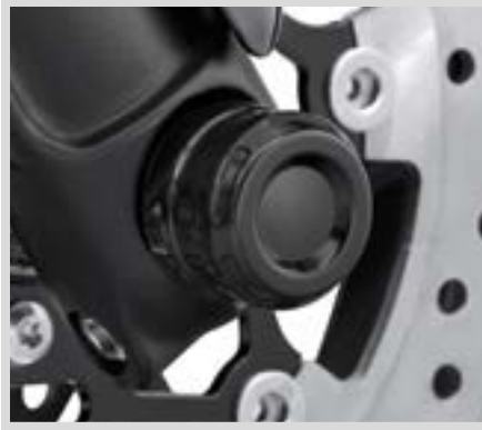
A. DOMINION MUTTERNKAPPEN FÜR VORDERACHSE – SCHWARZGLÄNZEND

Für VRSC™ '02-'11 (außer VRSCF und VRSCR), XG ab '15, XL ab '08, Dyna® '08-'17, Softail® ab '07 (außer Springer®, FLSTNSE, FXCW, FXCWC, FXSB, FXSBSE, FXSE, FXST-Aus und FXSTD) sowie Touring und Trike Modelle ab '08. FLDE, FLFB, FLFBS, FLHC, FLHCS, FLSB, FLFL, FXBB, FXBR, FXBRS und FXLR Modelle ab '18 erfordern Vorderachsen-Adapter-Kit P/N 43000090. FXLRS ab '20, FXDRS ab '19 sowie FXFB und FXFBS Modelle ab '18 erfordern Vorderachsen-Adapter-Kit P/N 43000159.