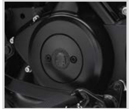
A. WILLIE G SKULL KOLLEKTION – MEDAILLON LINKS – SCHWARZ