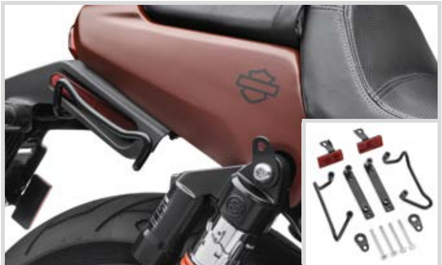
D. SPANNSEILBÜGEL – STREET ROD MODELL