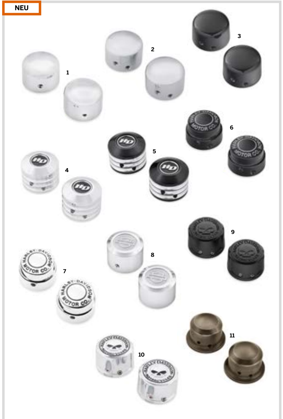
B. MUTTERNKAPPEN FÜR VORDERACHSE

Für VRSC '02-'11 (außer VRSCF und VRSCR), XG ab '15, XL ab '08 (außer XL1200X ab '16 und XL1200XS), Dyna '08-'17, Softail ab '07 (außer Springer, FLSTNSE, FLSB, FXCW, FXCWC, FXDRS, FXFB, FXFBS, FXLRS, FXSB, FXSBSE, FXSE, FXST-Aus und FXSTD), Touring und Trike Modelle ab '08. Softail Modelle ab '18 erfordern das separat erhältliche Vorderachsen-Adapterkit P/N 43000090.