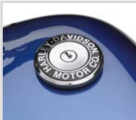
G. TANKDECKEL-MEDAILLON – H-D MOTOR CO SCHRIFTZUG