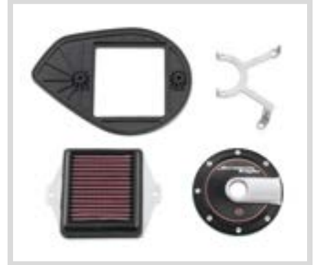
B. SCREAMIN' EAGLE PERFORMANCE LUFTFILTER-KIT – STREET