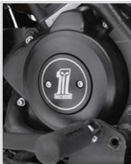
C. DARK CUSTOM LOGO KOLLEKTION – MEDAILLON LINKE SEITE