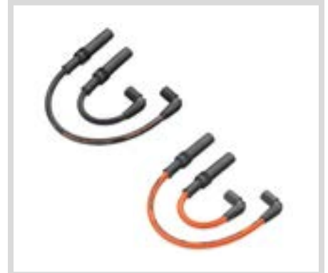
C. SCREAMIN' EAGLE 10 MM PHAT ZÜNDKERZENKABEL