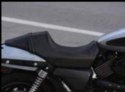
Café Solo-Sitz.....S. 17