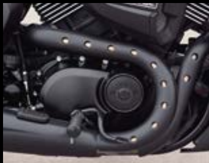
Buckshot Auspuff-Hitzeschild-Kit ..... S. 33