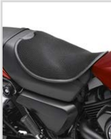
B. CIRCULATOR SITZPOLSTER (FAHRERPOLSTER ABGEBILDET)

Für Tanks zahlreicher Street, Sportster®, Dyna® und Softail® Modelle. Kann einen Teil der Tankgrafik verdecken. Prüfen Sie das Erscheinungsbild vor Anbringung am Tank.