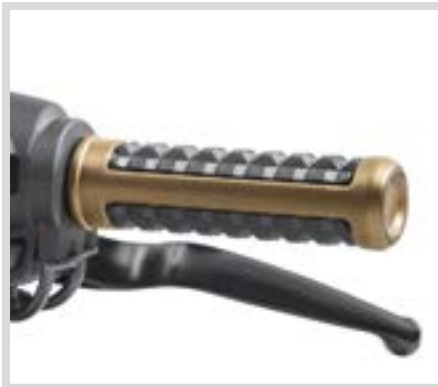
C. DOMINION LENKERGRIFFE – BRONZE