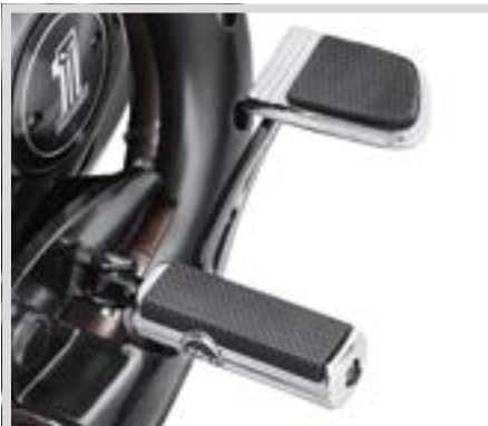
G. DEFIANCE KOLLEKTION HAND- UND FUSSHEBEL – CHROM