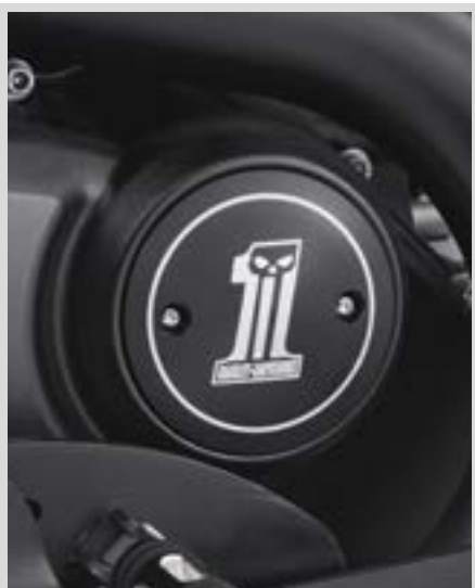
C. DARK CUSTOM LOGO KOLLEKTION – MEDAILLON RECHTE SEITE

25800091 Medaillon linke Seite. Für XG Modelle ab '15.