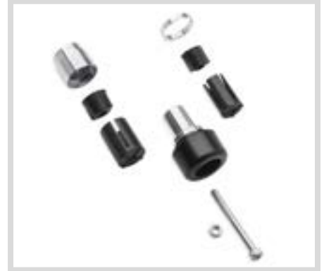
C. ENDKAPPEN FÜR LENKERGRIFFE