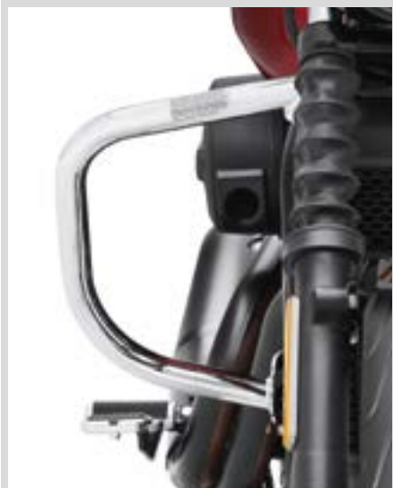
D. MOTORSCHUTZBÜGEL – CHROM