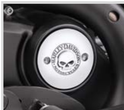
B. WILLIE G SKULL KOLLEKTION – MEDAILLON RECHTS – CHROM