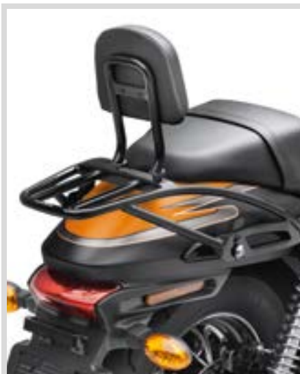
F. Sissy BAR BÜGEL (ABGEBILDET MIT GEPÄCKTRÄGER UND RÜCKENPOLSTER)