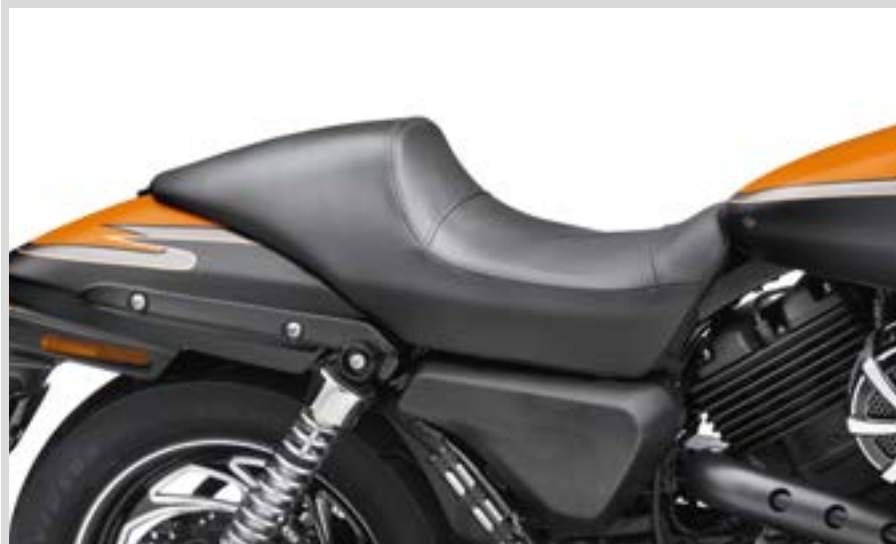
C. CAFÉ SOLO SITZ