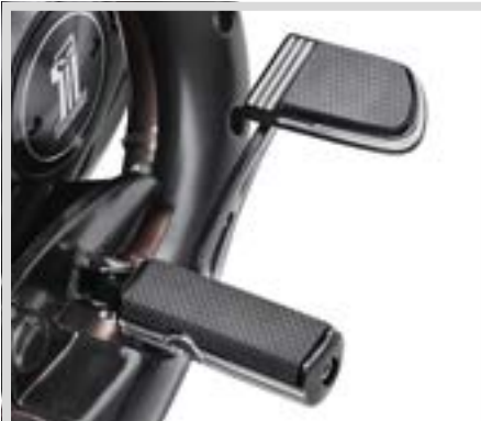
F. DEFIANCE KOLLEKTION HAND- UND FUSSHEBEL – SCHWARZ MASCHINELL BEARBEITET