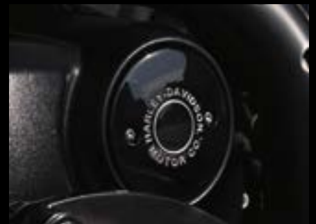
Harley-Davidson Motor Co.-Medaillon rechts.....S. 27