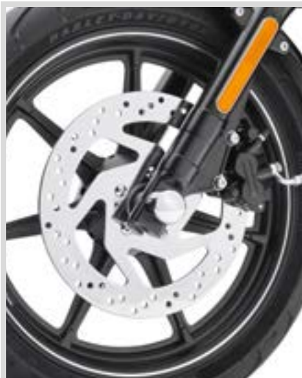
G. POLIERTE BREMSSCHEIBEN