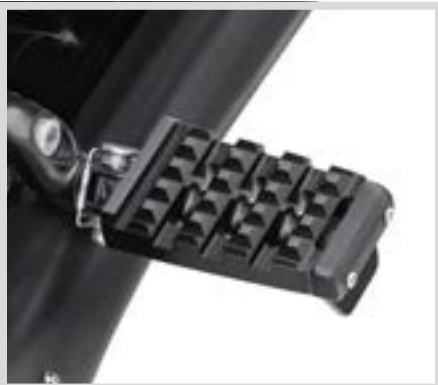
D. DOMINION FUSSRASTEN – SCHWARZGLÄNZEND