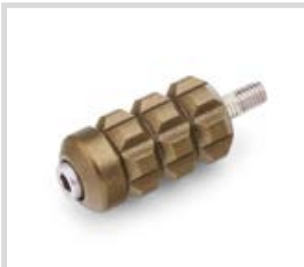
E. DOMINION SCHALTFUSSRASTE – BRONZE