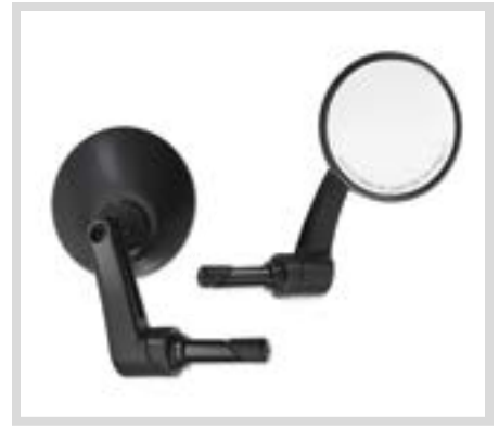
A. RUNDSTANGEN-ENDSPIEGEL - MATTSCHWARZ

Für serienmäßige Lenker oder Zubehör Lenker an XG Modellen ab '15 (außer Modelle mit Drag Bar P/N 55800225 oder 55800238), VRSC™ '02-'17 (außer VRSCF), XL und XR ab '96, Dyna® '96-'17 (außer FXDLS), Softail® '96-'15 (außer FLSTNSE, FXSBE und FLSTSE '11-'12) und Touring Modelle '96-'07. Der Einbau erfordert den separat erhältlichen Diamond Black Lenkergriff P/N 56100199 (1") oder 56100202 (7/8").