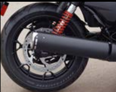
Screamin' Eagle® Slip-On-Schalldämpfer ..... S. 33