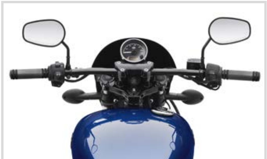
B. DRAG LENKER