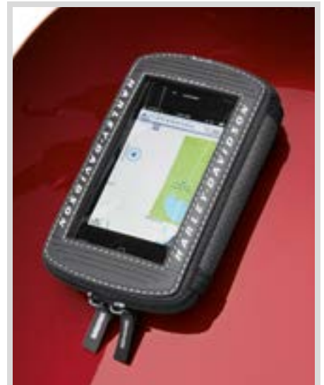
C. AUDIO PLAYER-TANKTASCHE