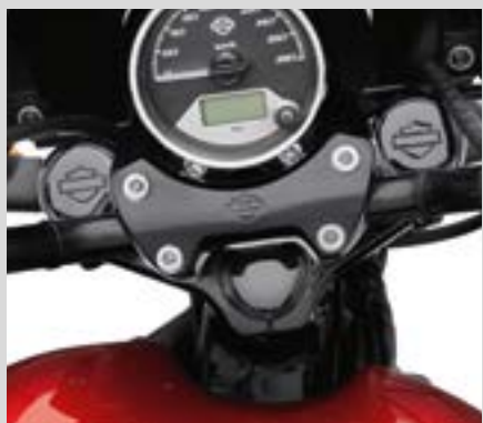
E. GABELHOLM UND BOLZENABDECKUNGEN FÜR LENKKOPF – SCHWARZGLÄNZEND