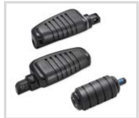
C. KAHUNA KOLLEKTION FUSSHEBEL – SCHWARZGLÄNZEND