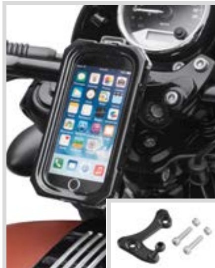
B. BEFESTIGUNG FÜR TELEFONHALTERUNG