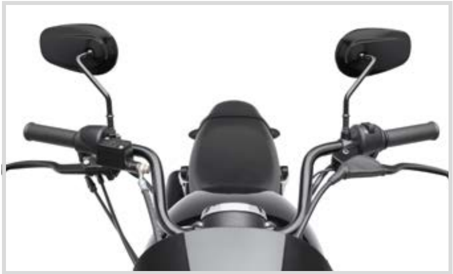
A. REACH LENKER

*HINWEIS: Manche Lenker und Riser können bei bestimmten Modellen Modifikationen an Kupplungs- und/oder Gaszug und Bremsleitungen erfordern.