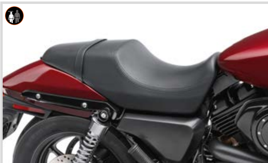
D. REACH SITZ

Für XG Modelle ab '15 (außer XG750A). Sitzbreite 10,5"; Soziussitzbreite 7,5".