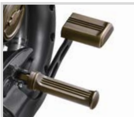
H. MESSING-KOLLEKTION HAND- UND FUSSHEBEL