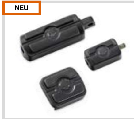
B. WILLIE G SKULL KOLLEKTION FUSSHEBEL – SCHWARZ