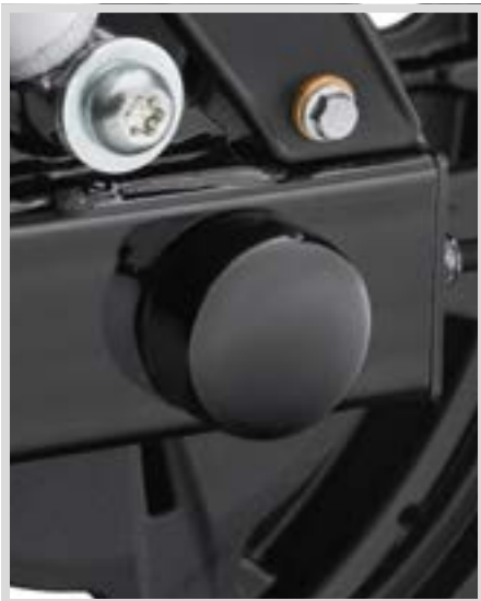
C. MUTTERNKAPPEN FÜR HINTERACHSE- SCHWARZGLÄNZEND

Fahrwerkverzierungen, Custom-Räder und -Brems scheiben