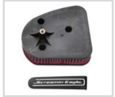
A. SCREAMIN' EAGLE PERFORMANCE LUFTFILTER-KIT – STREET ROD