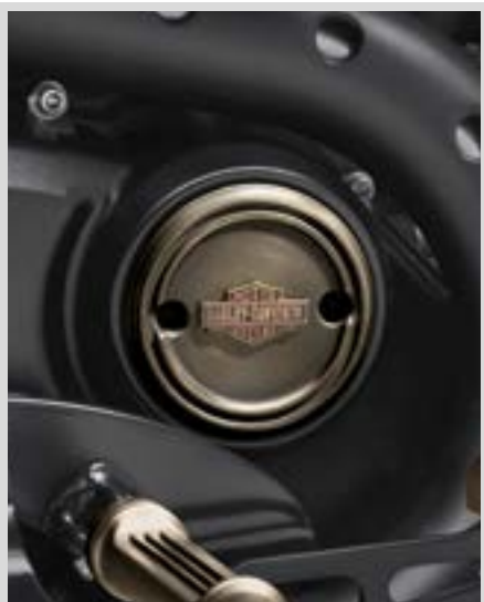
D. MESSING-KOLLEKTION – MEDAILLON RECHTS