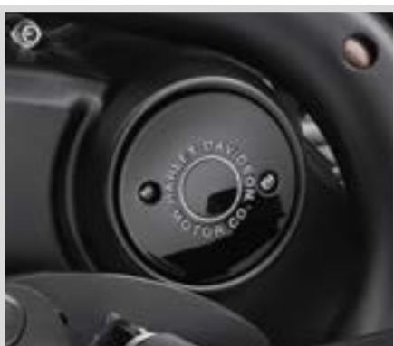
H. HARLEY-DAVIDSON MOTOR CO. KOLLEKTION – SCHWARZ MIT CHROM-SCHRIFTZUG – MEDAILLON RECHTS