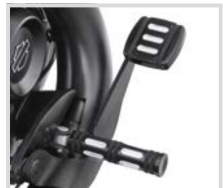
D. EDGE CUT KOLLEKTION HAND- UND FUSSHEBEL

Nicht alle Produkte sind in allen Ländern erhältlich – wenden Sie sich für Einzelheiten bitte an Ihren Händler.