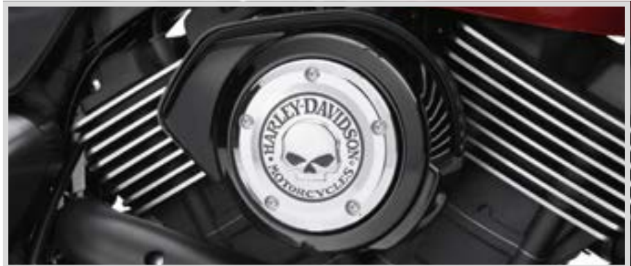
B. WILLIE G SKULL KOLLEKTION – LUFTFILTER-ZIERBLENDE – CHROM