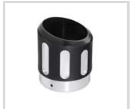
D. SCHALLDÄMPFER-ENDKAPPEN – EDGE CUT

*Nicht für Märkte mit EU-Verordnung 168/2013 zugelassen.