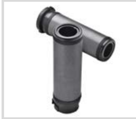
B. DIAMOND BLACK LENKERGRIFFE

Für XG Modelle ab '15. Der Einbau erfordert die separat erhältlichen Lenkerendspiegel P/N 56000133 und 56000134 oder Endkappen P/N 55900114.