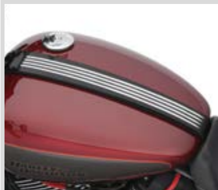
F. TANKZIERBLENDE - SCHWARZGLÄNZEND, MASCHINELL BEARBEITET