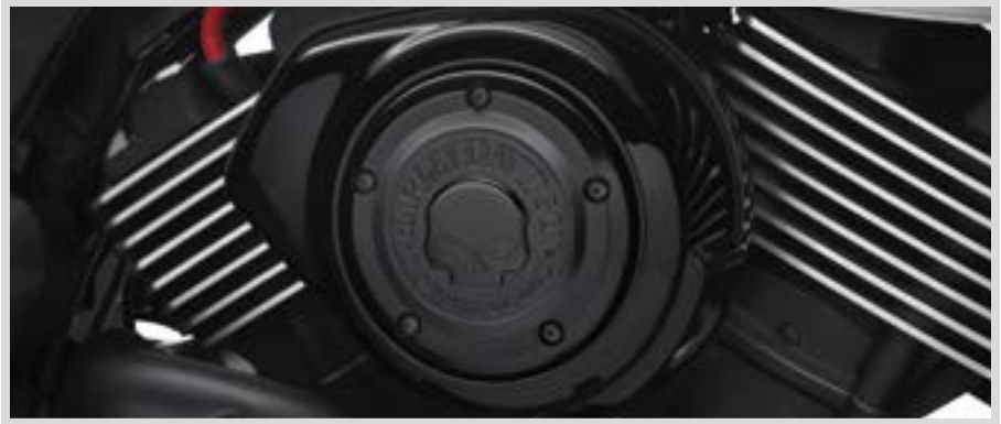
A. WILLIE G SKULL KOLLEKTION – LUFTFILTER-ZIERBLENDE – SCHWARZ

25700460 Medaillon linke Seite. Für XG Modelle ab '15.