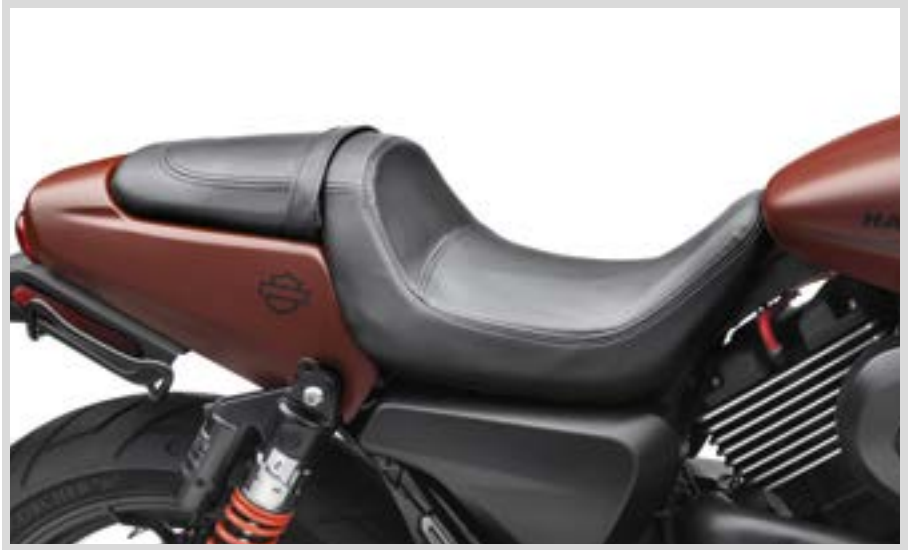
A. REACH FAHRERSITZ – STREET ROD MODELL

Für XG750A Modelle ab '17. Sitzbreite 10,75"