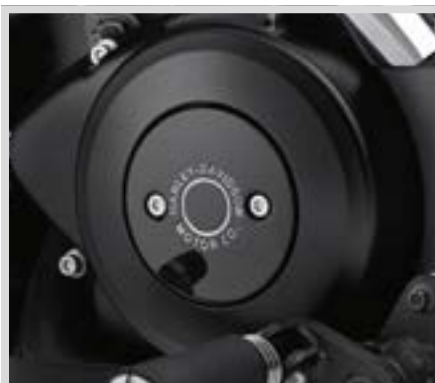
H. HARLEY-DAVIDSON MOTOR CO. KOLLEKTION – SCHWARZ MIT CHROM-SCHRIFTZUG – MEDAILLON LINKS