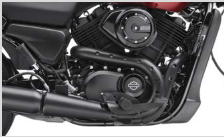
G. SCREAMIN' EAGLE BUCKSHOT AUSPUFF-HITZESCHILD-KIT – JET BLACK

*Nicht für Märkte mit EU-Verordnung 168/2013 zugelassen.