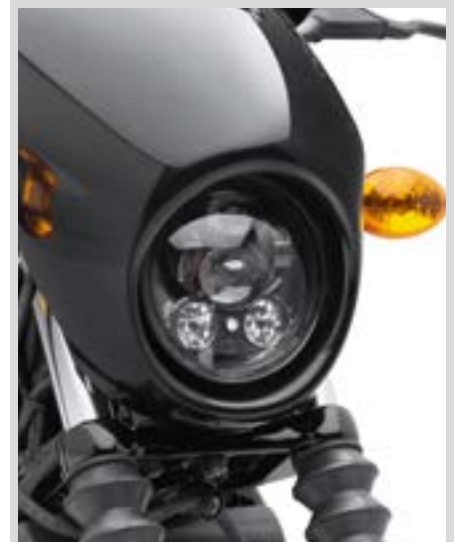
B. DAYMAKER LED-SCHEINWERFER – SCHWARZGLÄNZEND