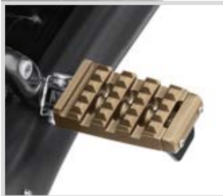
D. DOMINION FUSSRASTEN – BRONZE