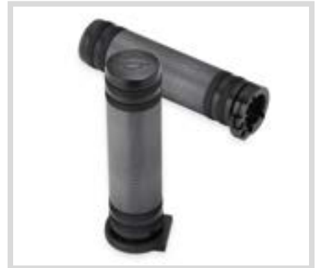
D. DIAMOND BLACK KOLLEKTION LENKERGRIFFE