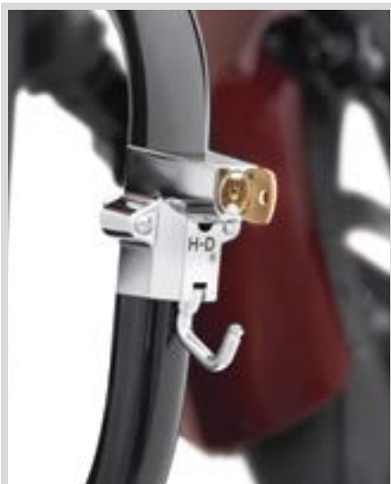
E. HELMSCHLOSS MIT UNIVERSALBEFESTIGUNG